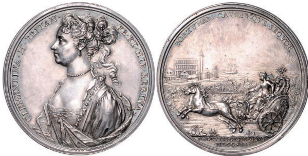
Fig. 1 - Ottone Hamerani, 1719, medaglia d'argento (48 mm). Maria Clementina Sobieska e fuga da Innsbruck www.coinarchives.com