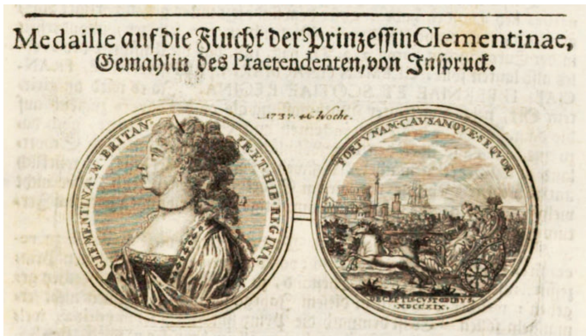
Fig. 4 - Medaglia di O. Hamerani con la fuga di Maria Clementina, da Lochner 1737.