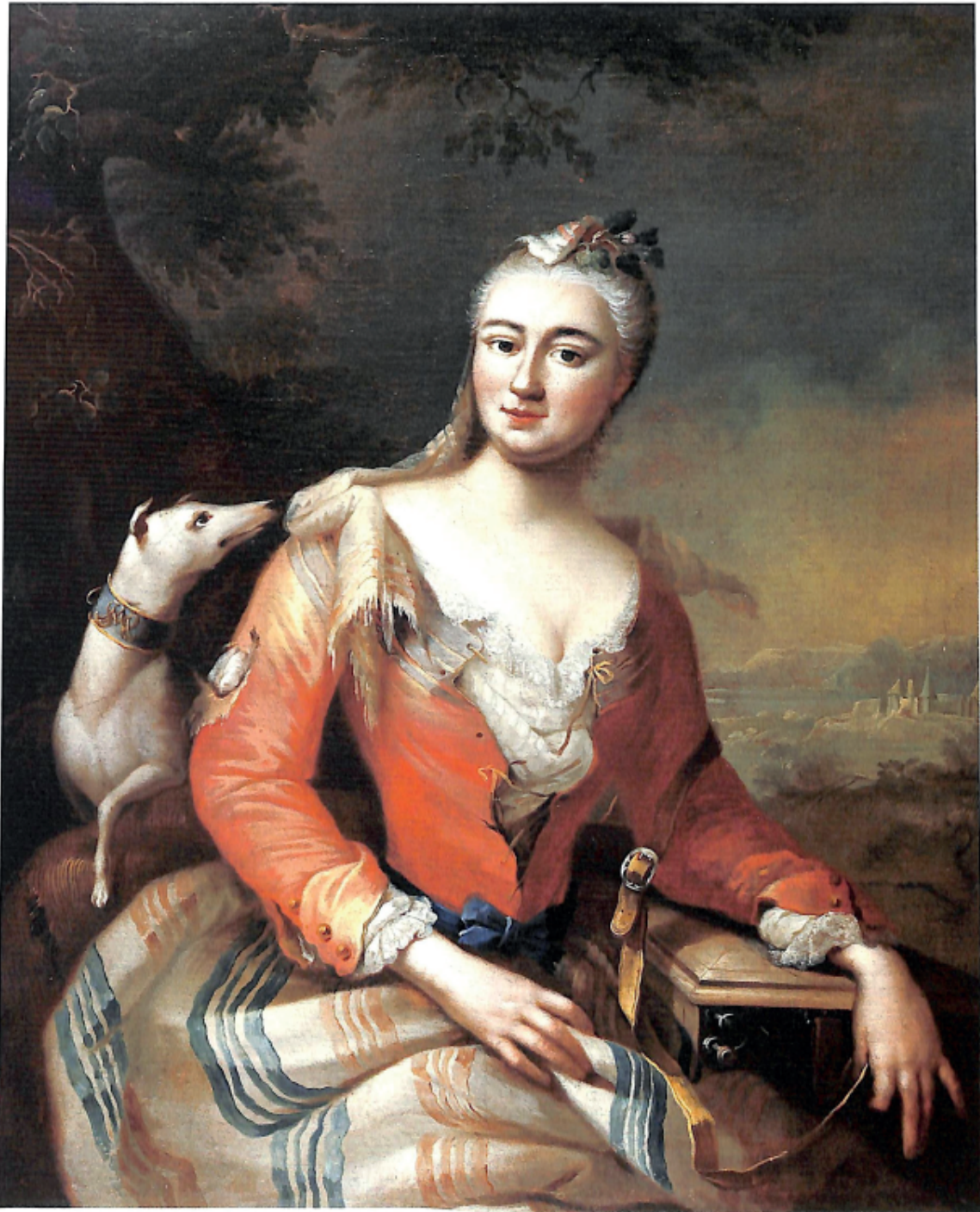
Fig. 3 - Tadeusz Kuntze (attribuito), Ritratto di Maria Casimira Sobieska, da Petrucci 2003.